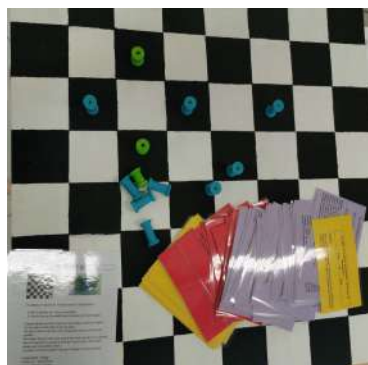
Jeu des 5 e 4

Les ambassadeurs étant des élèves de 5 e , chaque classe de 5 e a réalisé un jeu de société avec : le plan de jeu, les pions, les cartes pour jouer et les règles du jeu. Chacun des jeux est différent parce que ce sont les ambassadeurs qui ont défini les grandes lignes des jeux de société de leur classe.