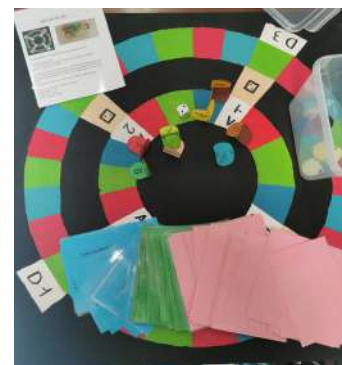
Jeu des 5 e 1

Les élèves ont pu profiter des différents domaines de l'équipe encadrante, la CPE pour la loi, l'Infirmière pour la santé, le professeur documentaliste pour la partie historique et le professeur d'Arts Plastiques pour la création des plateaux de jeu, des pions et des règles du jeu. Tous les élèves de 5 e ont travaillé sur la réalisation des questions qui portent donc sur la loi, la santé et l'histoire du droit des femmes.