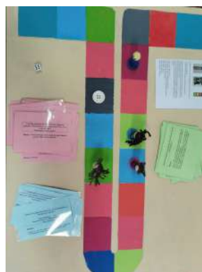
Jeu des 5 e 3