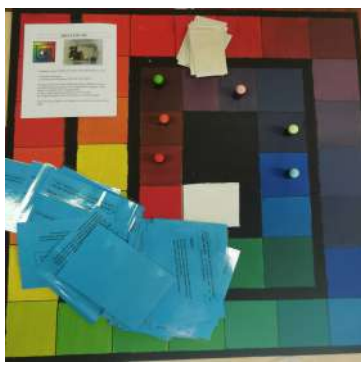
Jeu des 5 e 2